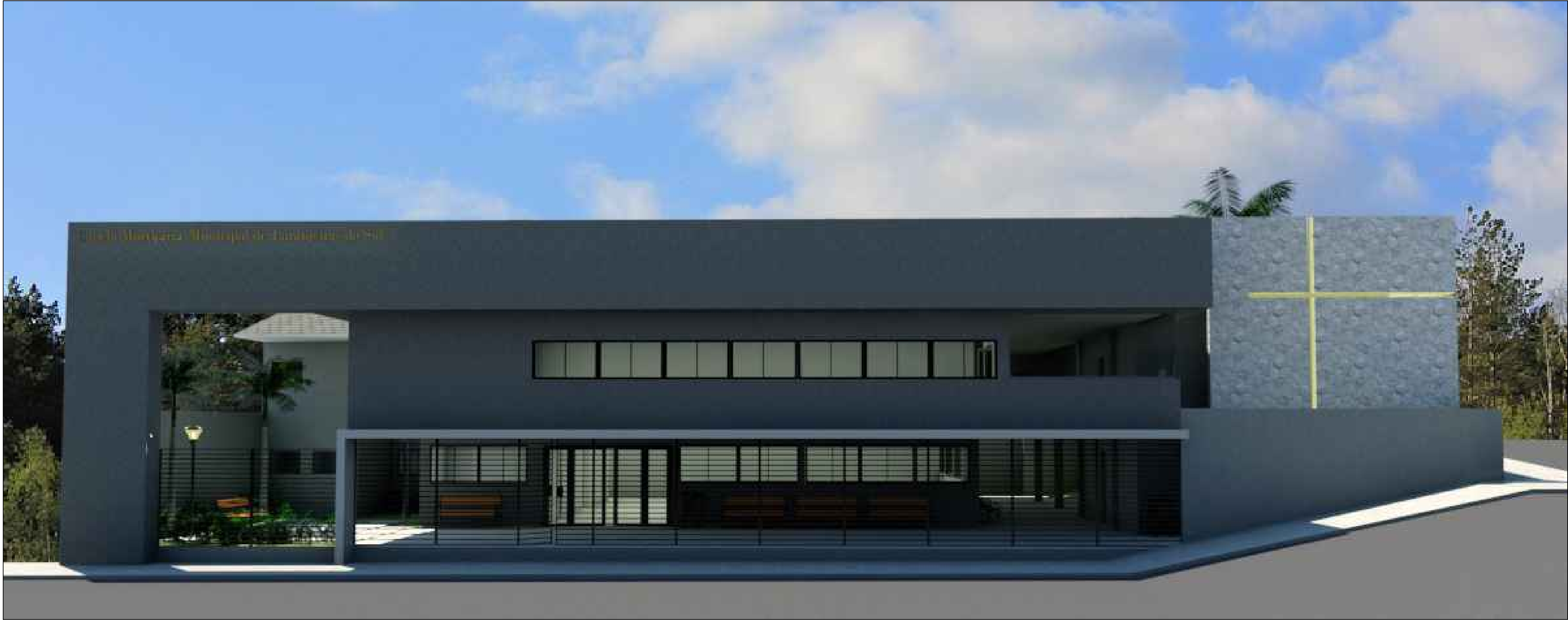
IMAGEM LATERAL SEM ESCALA