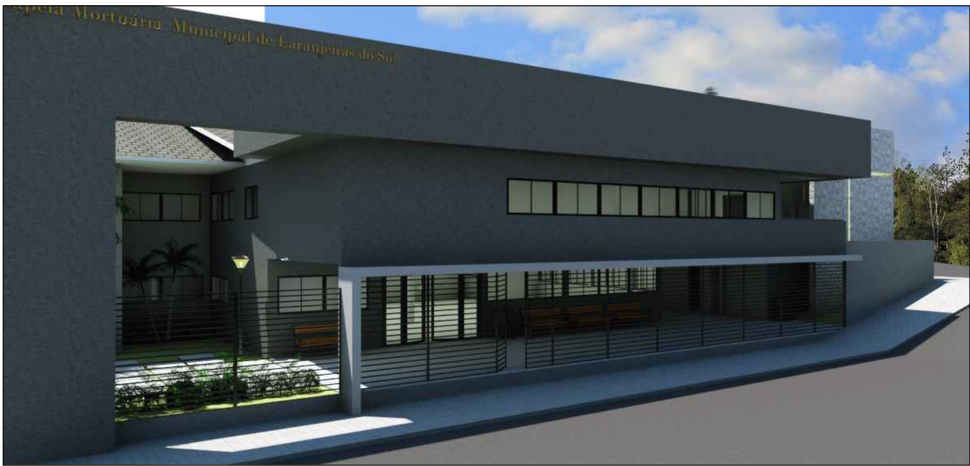
IMAGEM SEM ESCALA